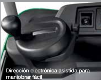
Dirección electrónica asistida para maniobrar fácil