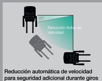
Reducción automática de velocidad para seguridad adicional durante giros