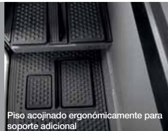
Piso acolchado ergonómicamente para soporte adicional