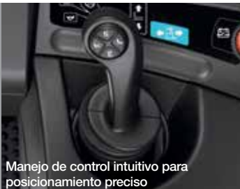
Manejo de control intuitivo para posicionamiento preciso